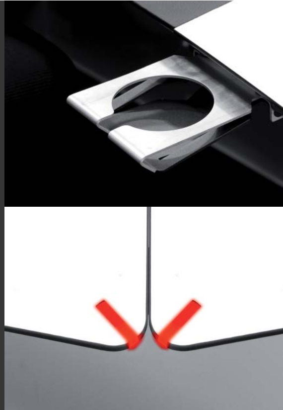
Leds de Seguridad Safety Leds