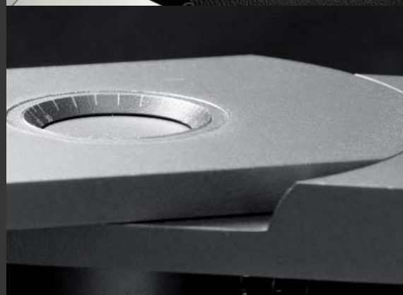
Generador de Grados Corner